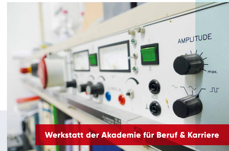
Werkstatt der Akademie für Beruf & Karriere